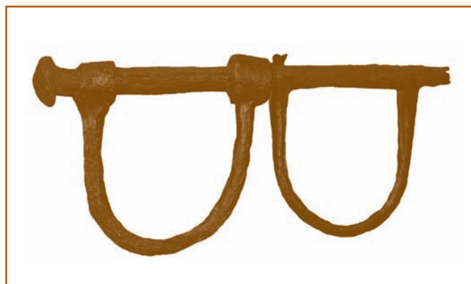
Antiguos grilletes usados para esposar a los esclavos.

El texto íntegro del poema está en: José Lezama Lima, ANTOLOGÍA DE LA POESÍA CUBANA , Tomo I: Siglos XVII - XVIII. La Habana: Consejo Nacional de Cultura, 1965, pp.156 - 164.